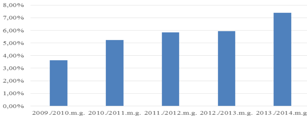
No kopējā pedagogu skaita pensijas vecumā - %

Statistika dati liecina, ka pedagogu “auditorijas” novecošanās tendences rezultātā palielinās pensijas vecuma pedagogu skaits, kā arī to, ka esošajā modelī nodrošinātais minimālais atalgojums (par likmi) nav saistošs jauniem skolotājiem, līdz ar to gados jaunu pedagogu skaits sistēmā ir un paliek nemainīgs.