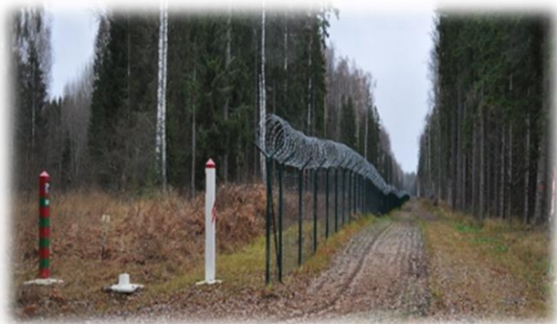
Valsts robežsardzes koledžas mācību robeža (pašreiz)

Mācību valsts robežas posma (~832m) izbūve un iekārtošana ietver robežuzraudzības sistēmu un būvju izveidi t.sk. visa veida robežzīmes, inženiertehniskā būves – divu veidu žogi ar vārtiem, kvadriciklu un taktisko transportlīdzekļu patrulēšanas taka ar tiltiņu, pēdu kontroles josla, integrētas dienas/nakts videonovērošanas, vairāku veidu klātbūtnes uztveršanas sistēmas un datu pārraides sistēmas uz optiskā kabeļa pamata.